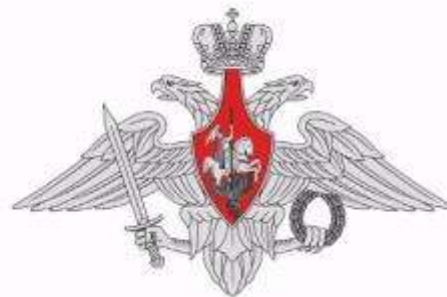
Орел Минобороны России – официальный символ Министерства обороны Российской Федерации