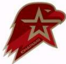
Знак отличия «Золотой знак Юнармейца»