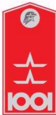
Заместитель командира отряда