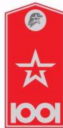
Руководители центральных и региональных органов движения