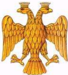
Государственный Орел – герб Великого князя московского Ивана III Васильевича