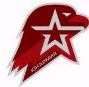
Орленок Юнармии – младший символ в ряду старших и великих

На Руси изображение двуглавого орла появилось в XV веке на печати Великого князя московского Ивана III Васильевича. Орёл становится гербом и символом Государства Российского.