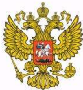
Государственный Орел – официальный государственный символ Российской Федерации